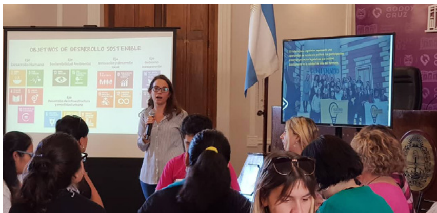
Presentación de los Objetivos de Desarrollo Sostenible en el inicio del Programa.

a solicitar y recibir información pública sin necesidad de justificar el pedido, obligando a los órganos estatales a responder.