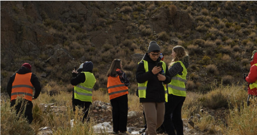
Durante “Experiencia 360°”, se realizó una visita al proyecto PSJ Cobre Mendocino, ubicado en Uspallata, Las Heras.

A partir de estos dos módulos, el cronograma de Experiencia 360° contó también con un espacio de formación brindado desde la Dirección de Fiscalización y Control Ambiental de Mendoza, orientada hacia el desarrollo de actividades mineras en la provincia. Como complemento y actividad vivencial, junto a los y las voluntarios se realizó una visita de PSJ Cobre Mendocino , uno de los proyectos mineros más cercano al inicio de actividades productivas.