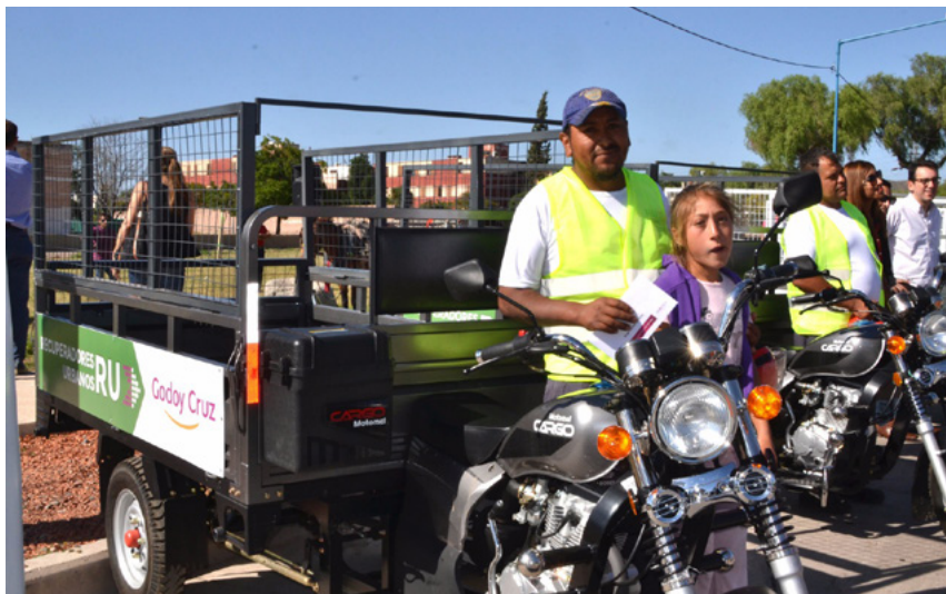
Entrega de motocarros a recuperadores urbanos durante 2017, a partir del diseño del programa “Basta de Tas” en Godoy Cruz.

Las cifras nacionales que fundamentaron el proyecto son elocuentes: más de 250.000 familias utilizan esta modalidad, 57.000 niños trabajan vinculados a la recolección de residuos y alrededor de 70.000 equinos sufren explotación en estas tareas.