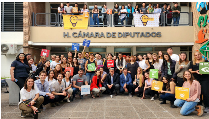
Año tras año, voluntarios y voluntarias se suman a una experiencia transformadora.

En ese contexto, el Voluntariado Legislativo se presentó como una innovación institucional que conjugaba dos dimensiones poco exploradas: por un lado, la educación cívica con herramientas técnicas de redacción legislativa; y por otro, la apertura de los espacios de representación a la ciudadanía.