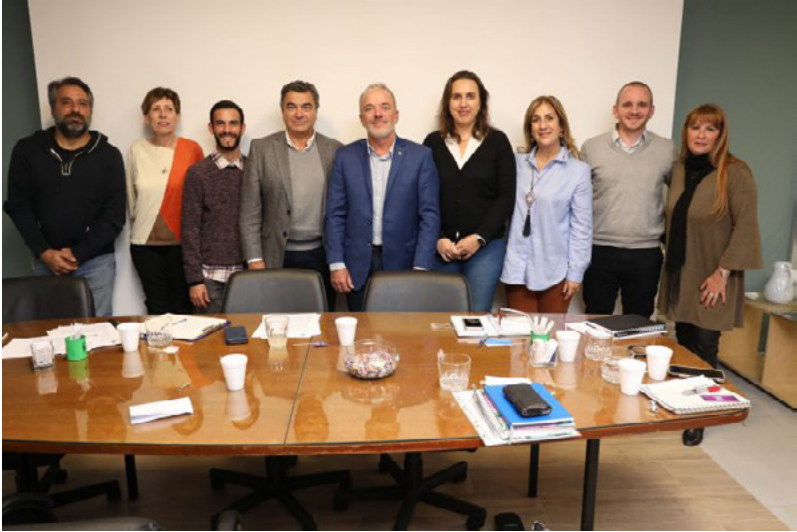
Intenso trabajo en 2019 para el tratamiento de la Ley 9.143, diseñada gracias a la experiencia de Voluntariado Legislativo