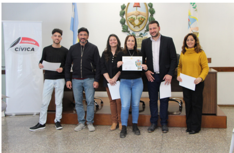
Cierre de la edición “Concejo + Vos”, junto a autoridades del Concejo y parte del equipo de Voluntariado Legislativo.

“Para la Cámara, trabajar con este Programa es fortalecer la apertura y la legitimidad de la tarea legislativa, porque, en definitiva, las leyes que discutimos y aprobamos tienen como destinatario final a la sociedad mendocina. Pero también es una forma de que muchos que hasta esa instancia desconocían la labor legislativa, se interesen, se motiven a participar, a proponer, debatir