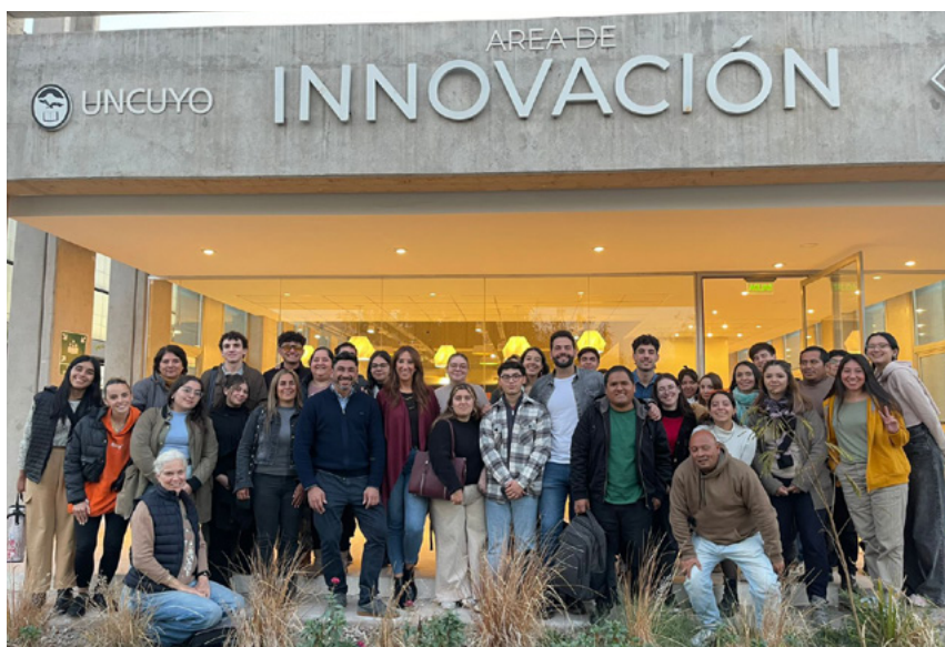
El Área de Innovación de la UNCUYO, ubicada en el Parque TIC de Godoy Cruz, fue uno de los espacios protagonistas de la formación.