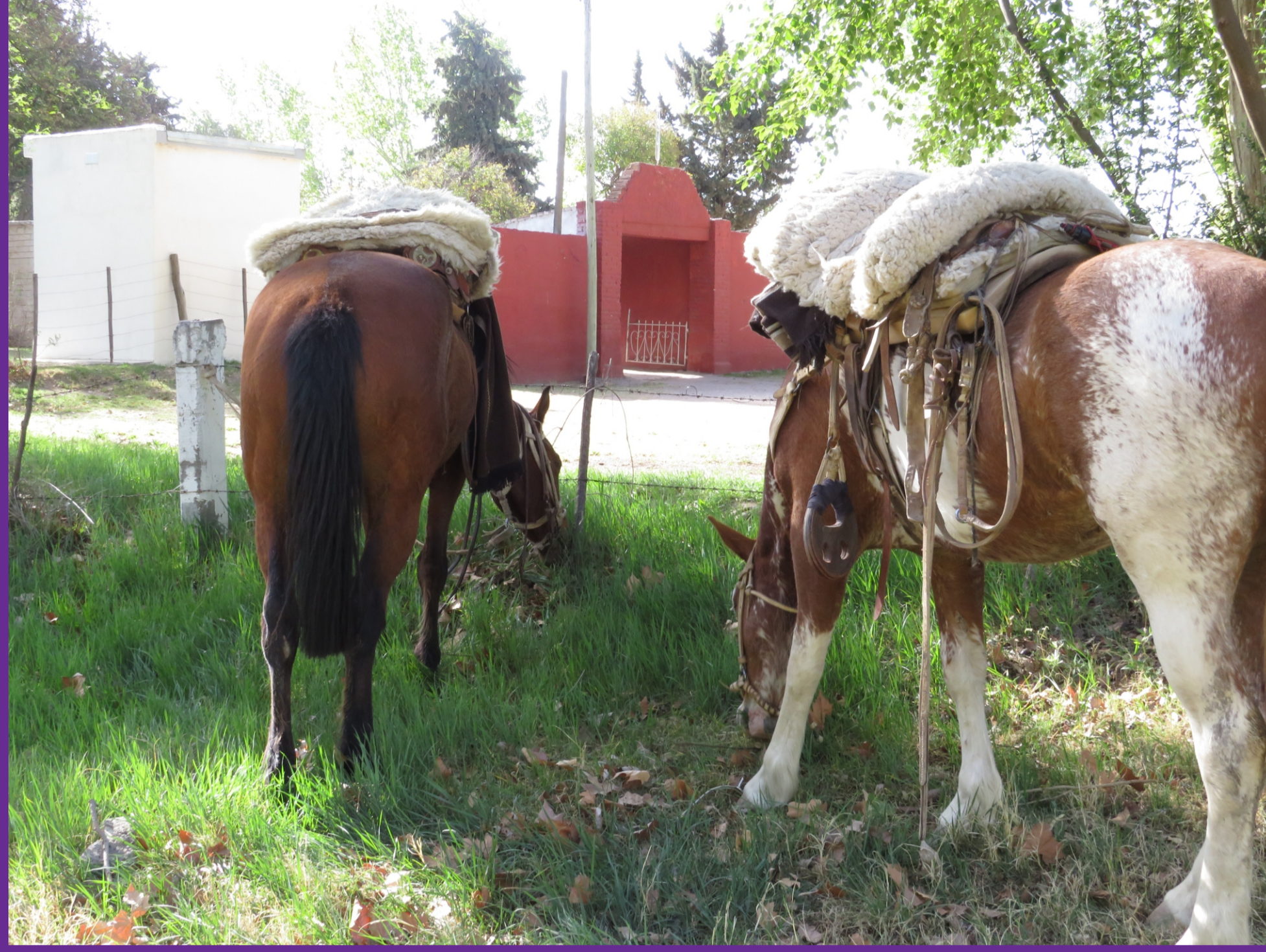
Figura 2 - Área de ingreso al cementerio de la Villa 25 de Mayo con detalle de caballos de deudos.