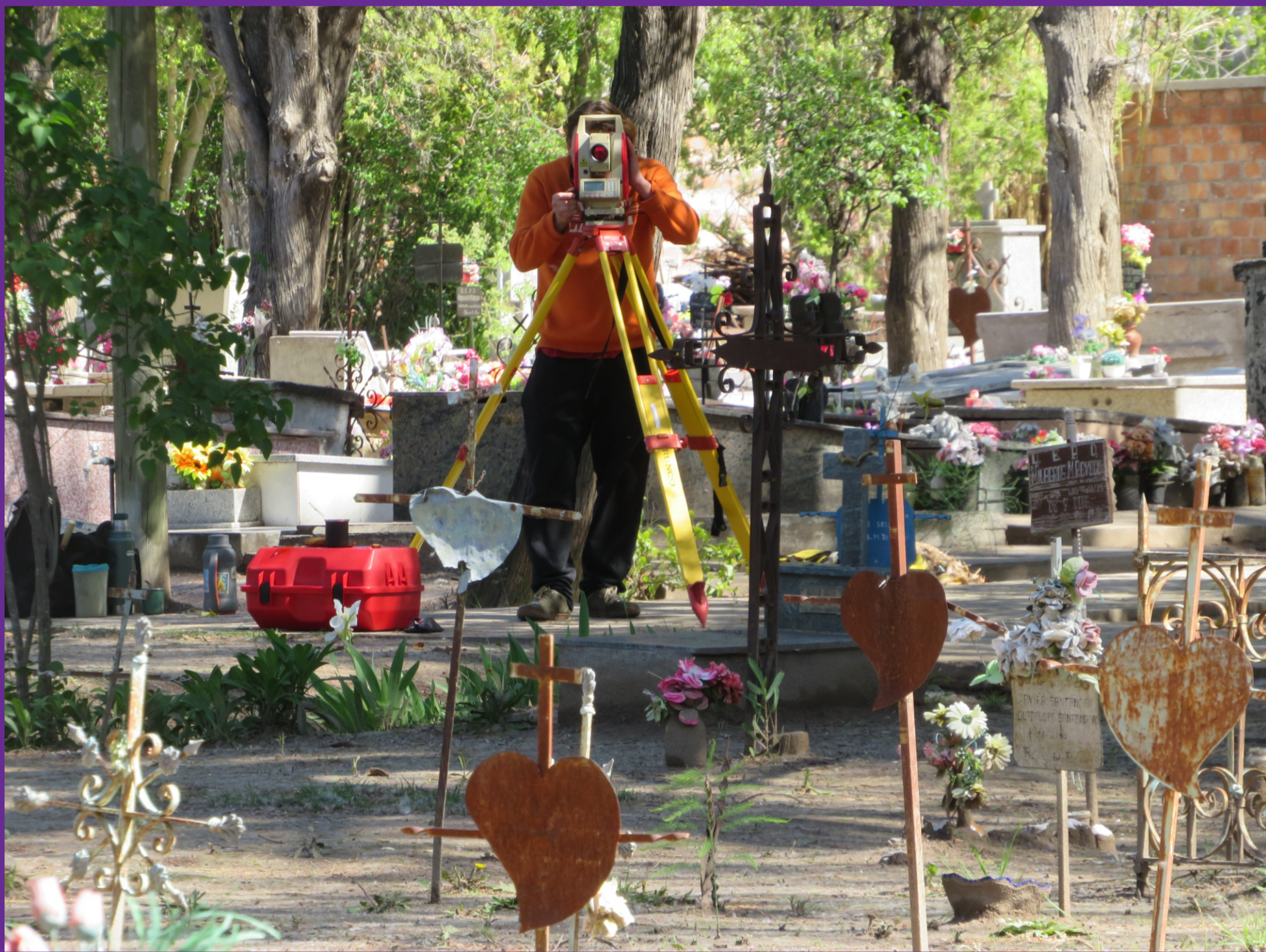
Figura 3 - Vista Interior desde el Sector 1 del cementerio de la Villa 25 de Mayo y levantamiento topográfico del área.