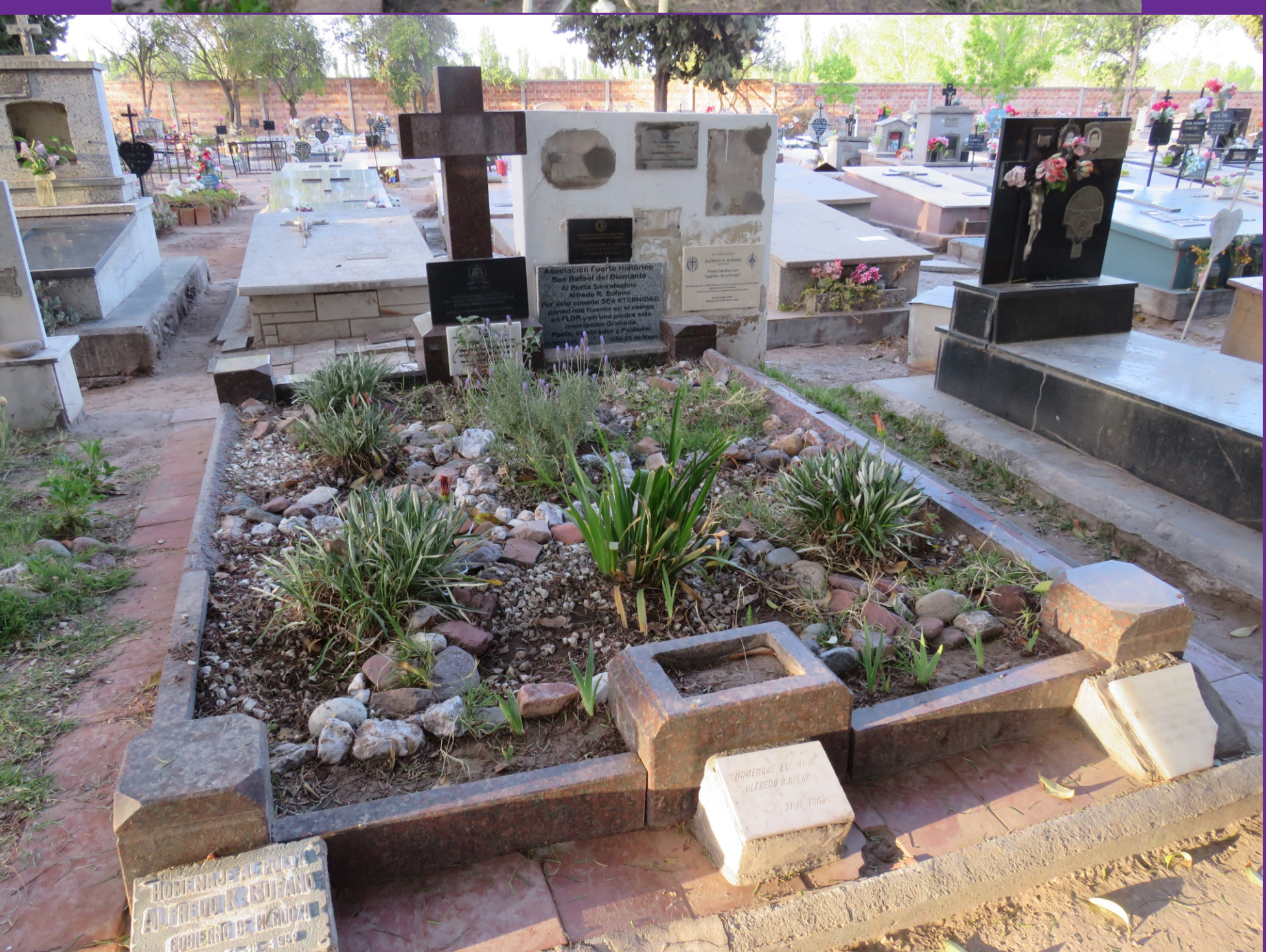
Figura 4 - Detalle de Cruz forjada con registro de pionera de la Villa 25 de Mayo. Debajo, tumba del poeta Alfredo Rodolfo Bufano.