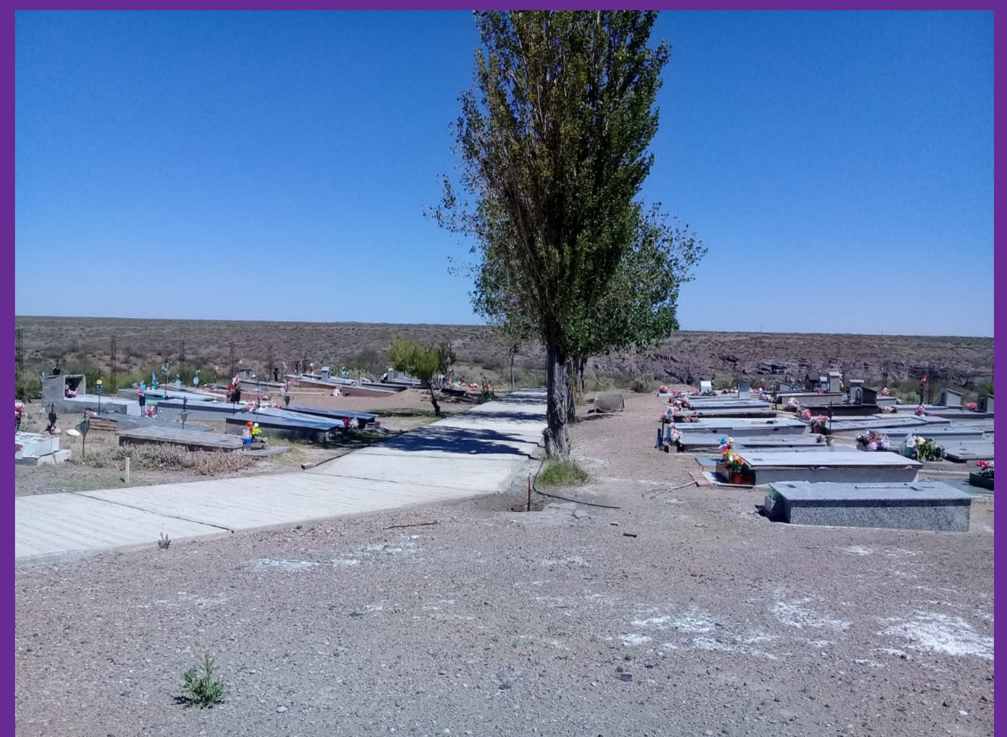
Figura 6 - Interior del camposanto con vista al oeste con dirección al altar y Cañón del río Atuel.