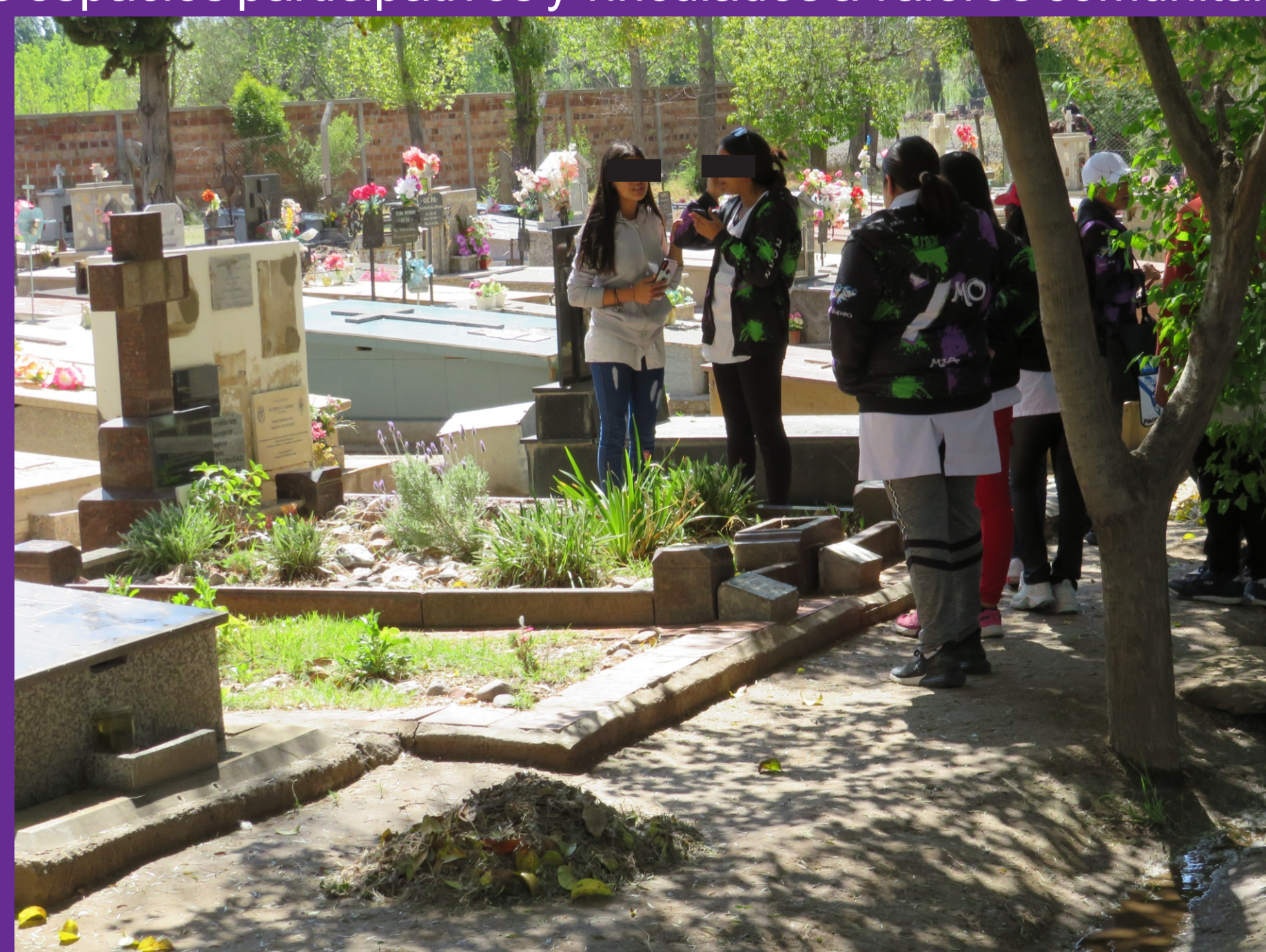
Figura 9 - Salida educativa de la escuela Alfredo R. Bufano de la Villa 25 de Mayo.

Los dos cementerios relevados representan dos necrópolis rurales (Nagel, 2019) con valores únicos y auténticos respecto a los procesos demográficos desarrollados regionalmente por más de 200 años y aquellos que hacen al presente de las poblaciones actuales. Con respecto a esto, la propuesta de mapeo cultural de estos espacios se suma a la propuesta de la Declaración de Paysandú (2010) de integrar a estos espacios a proyectos pedagógicos y la Carta de Roma (2020) como espacios participativos y vinculados a valores comunitarios.