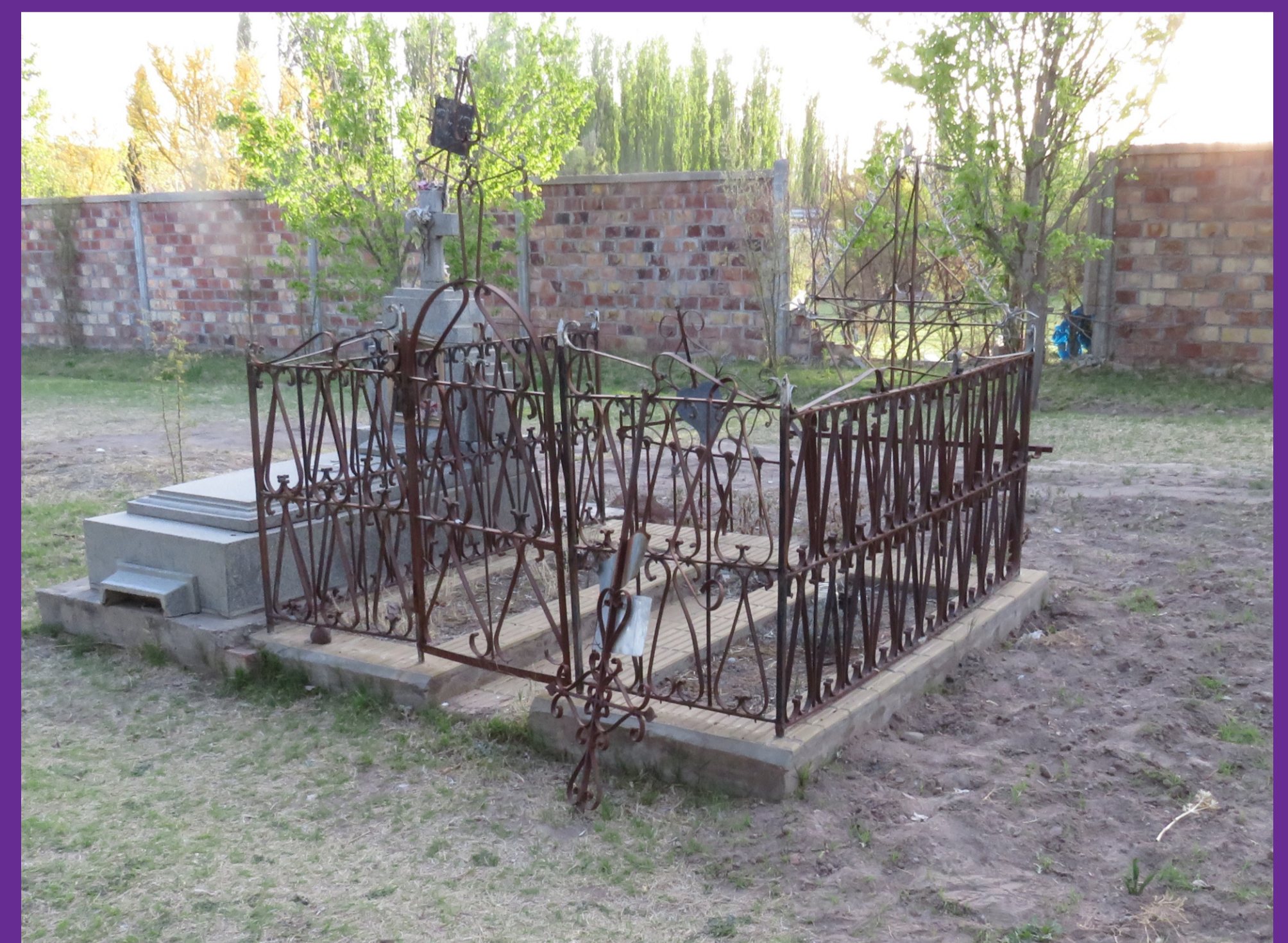
Figura 8 - Cuna de hierro forjada "cunita" o "corralito", ca. 1890. Cementerio Villa 25 de Mayo