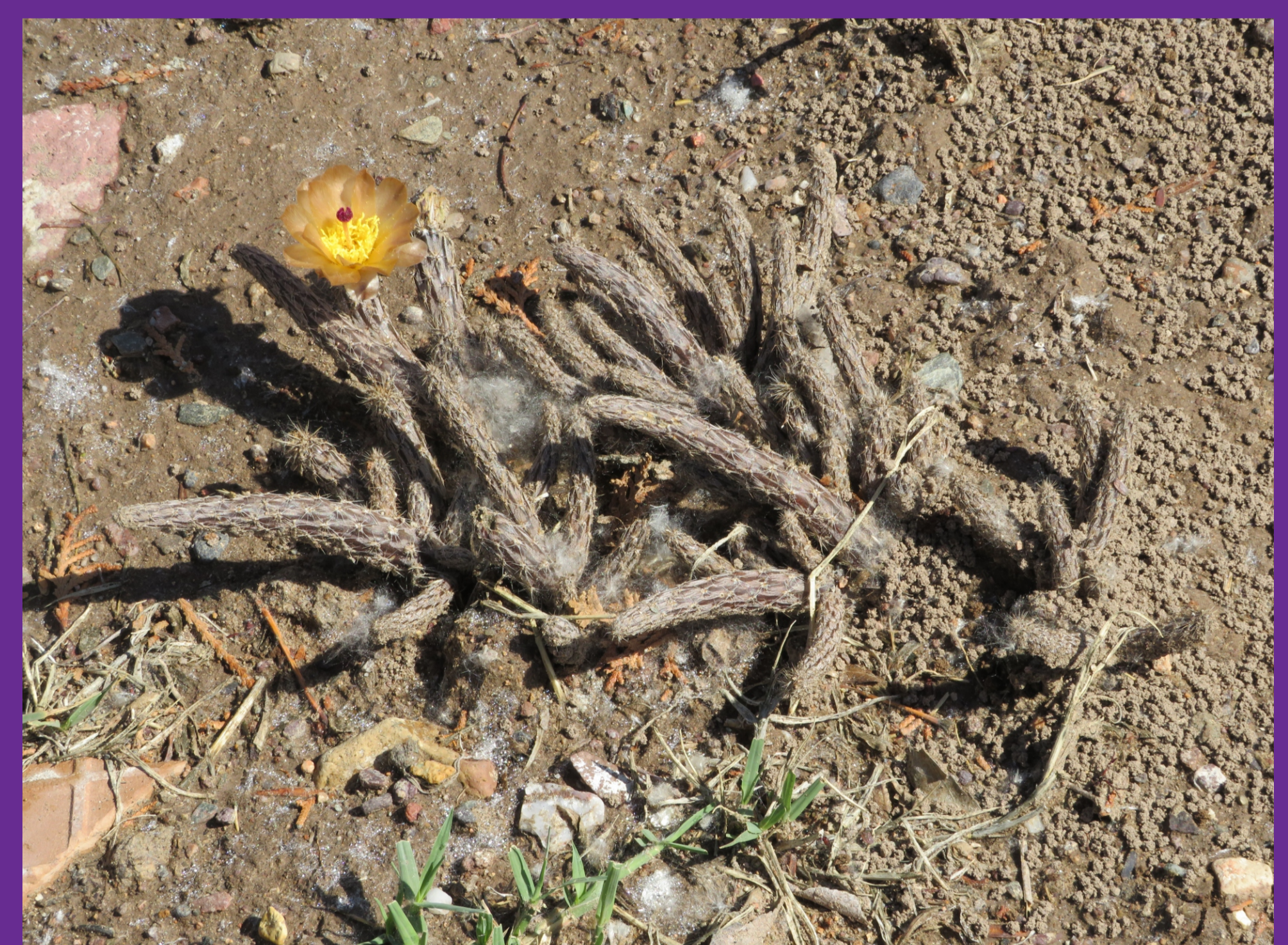
Figura 7 - Ejemplar de Pterocactus tuberosus (Pfeiff.) Britton & Rose f. tuberosus