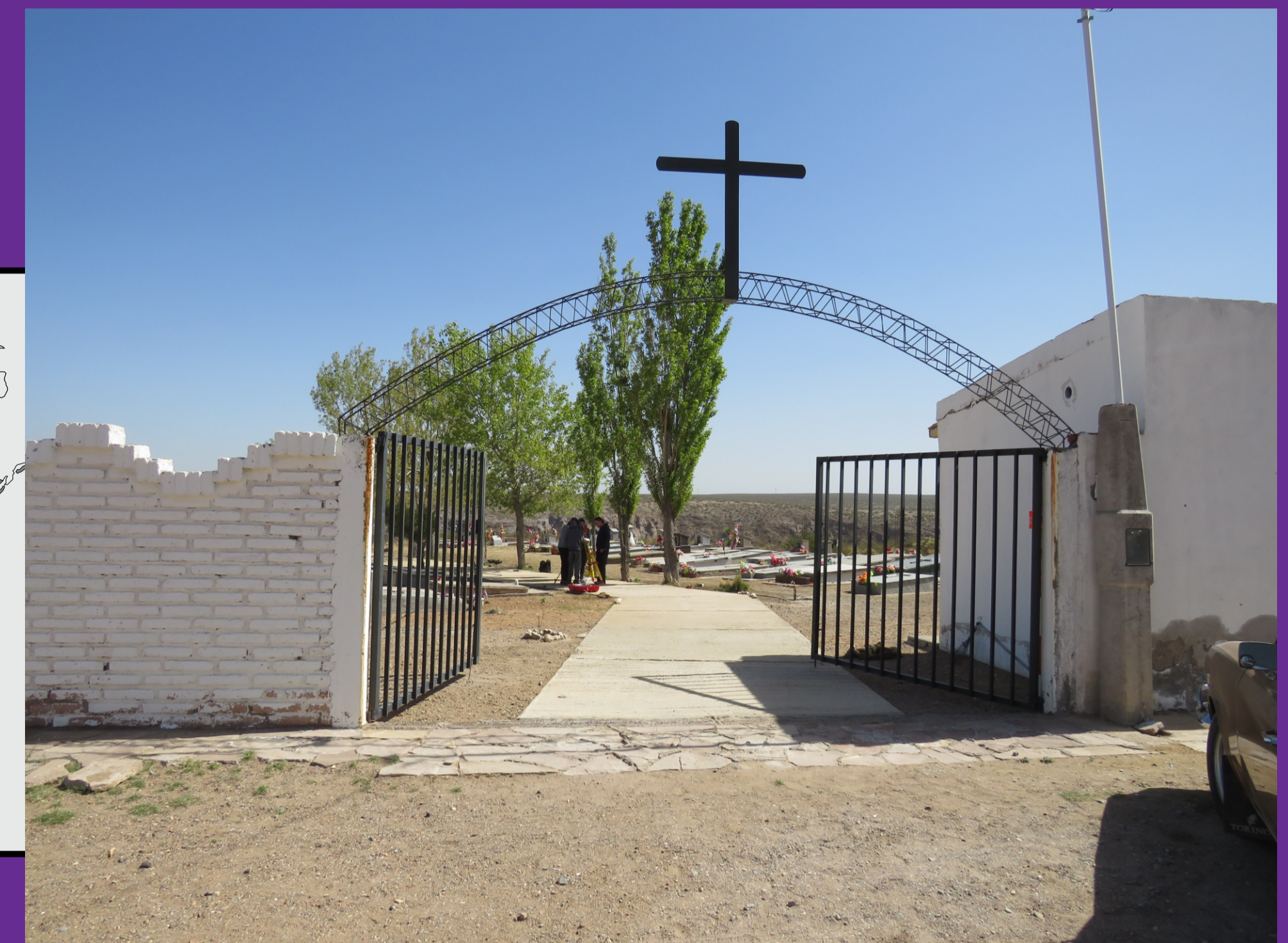
Figura 5 - Ingreso al Cementerio de El Nihuil.