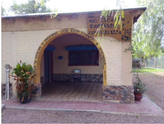
Imagen 4 - Salida al terreno - Equipo Escuela Campesina