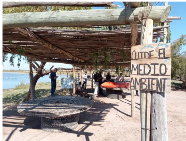
Imagen 3 - Salida al terreno - Equipo Laguna de Soria - Lavalle

Las prácticas en territorio se desarrollaron en grupos reducidos, con un docente tutor y un referente de la institución u organización social involucrada (imágenes 3 y 4 ).