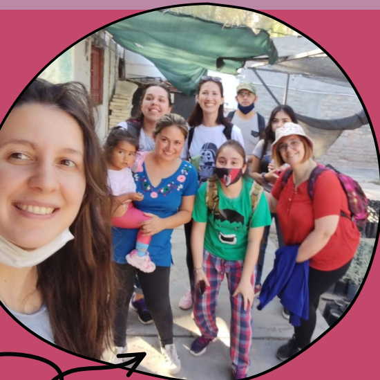
Visita al vivero de la organización

Un grupo de 6 estudiantes comienzan a trabajar no sólo con representantes de la organización sino también con distintos actores sociales de la comunidad. A través de distintas técnicas, entre ellas un mapeo social, identifican que uno de los mayores problemas locales es el acceso al bien común agua. Deciden entonces trabajar sobre esta temática en sus facetas de disponibilidad, accesibilidad y calidad.