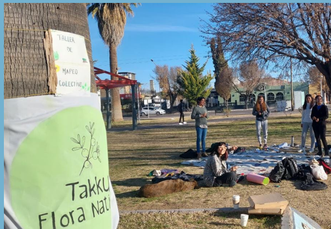
Taller de Mapeo Colectivo en La Consulta

En esta práctica les estudiantes de tercer año de las carreras de Geografía comenzaron el acercamiento a distintas organizaciones, territorios y conflictos. En el mes de junio desarrollaron distintos trabajos que realizaron para y con las organizaciones.