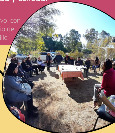
Taller de Mapeo Colectivo con distintos actores del territorio de Capdeville