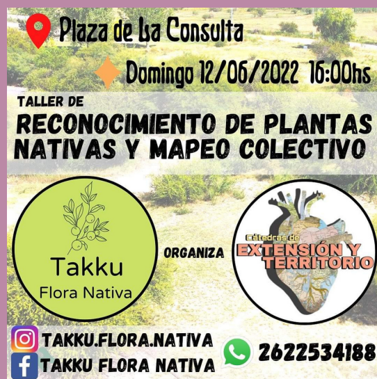
Convocatoria conjunta para taller junto a la organización

Con esta organización del Valle de Uco participamos junto a 4 estudiantes en una actividad de plantación de nativas en San Carlos, luego compartimos un taller con otras organizaciones similares en el CICUNC y finalmente los estudiantes realizaron un mapeo colectivo en el mes de junio en la plaza del pueblo de La Consulta donde pudieron compartir un folleto virtual que realizaron para escanear con QR y poder reconocer plantas nativas.